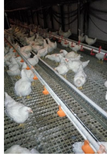
Gambar 8. Jalur mesin pakan.

Untuk pakan yang keluar dari mesin pakan ini sendiri ketinggian pakannya didalam jalur telah diperhitungkan yaitu setinggi 2 cm, berlaku dari depan area kandang hingga bagian belakang kandang dikarenakan agar bobot ayam pada bagian area depan dengan bagian area belakang memiliki bobot yang sama antara ayam satu dengan ayam lainnya, seperti pada Gambar 8 di bawah ini.