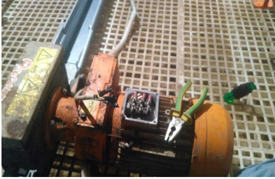
Gambar 4. Proses pemasangan motor listrik

dihidupkan secara manual dengan menggunakan saklar yang berada di tiang dalam kandang seperti pada Gambar 4 di bawah ini.