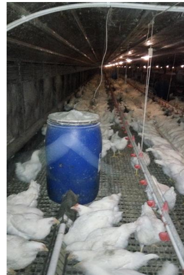
Gambar 6. Penampungan pakan ayam

Untuk kendala yang dialami sendiri pada mesin through ini yang paling sering yakni putusnya rel yang berada didalam jalur mesin pakan dikarenakan dari kualitas rel itu sendiri yang sudah seharusnya diganti karena sudah banyak yang mengalami korosi yang mengakibatkan kekuatan dari rel itu sudah rentan sehingga mudah putus ketika mesin sedang beroperasi seperti pada Gambar 6 di bawah ini.