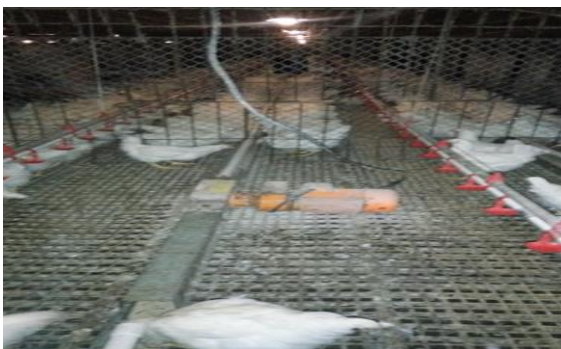
Gambar 5. Mesin pakan yang dioperasikan

Sebelum dihubungkan pada sumber listrik terlebih dahulu dilakukan pemasangan pada jalur keluarnya pakan barulah kemudian peletakan mesin motor listrik sebagai penggerak utama mesin through. Pada satu jalur mesin pakan ini dapat menggerakkan rel dalam jalur pakan sepanjang \pm 120 meter. Dalam pemasangannya sendiri biasanya dalam satu area kandang terdapat 3 buah mesin pakan yang mana penggunaannya sebagai jalur pakan area ayam betina dan area ayam pejantan seperti pada Gambar 5 di bawah ini.