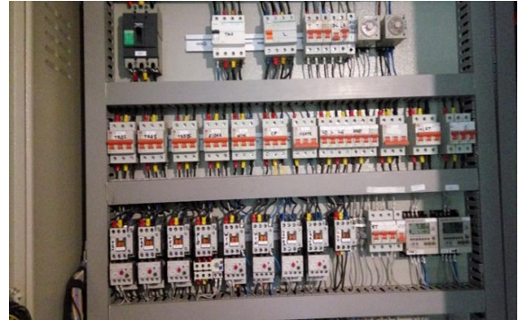
Gambar 3. Panel instalasi mesin pakan

pertumbuhan seperti pada Gambar 3 di bawah ini.